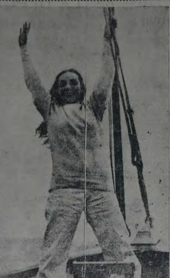
UNO DE LOS MAS RECIENTES RETRATOS DE LA AFAMADA ACTRIZ MEXICANA QUE ACTUALMENTE TRABAJA PARA "ARTISTAS UNIDOS".